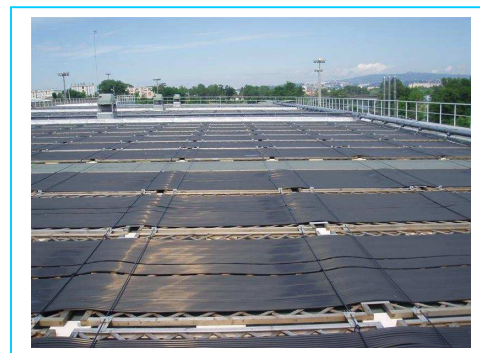
Moquette solaire pour chauffer l'eau

*FMI : Fréquentation Maximale Instantanée